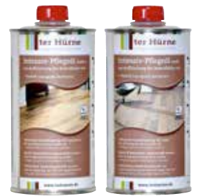
Intensieve onderhoudsolie kleurloos/wit

Opmerking: bij extreme slijtage moet het oppervlak bij voorkeur door een gekwalificeerde parketteur worden behandeld.